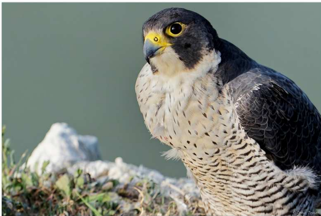
Faucon pèlerin