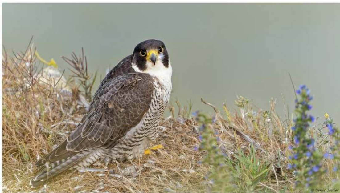
Faucon pèlerin

LE FAUCON PELERIN ( Falco peregrinus ) a fait son retour en Normandie depuis 1994 (Guillemont et al. 1995) après sa disparition due principalement à l'intoxication par les pesticides organochlorés (Monneret 2000). Les bénévoles de la LPO Normandie ont suivi des sites de nidification depuis plusieurs années. Nous donnons un rapide aperçu du suivi de la reproduction normande au cours des dernières années.