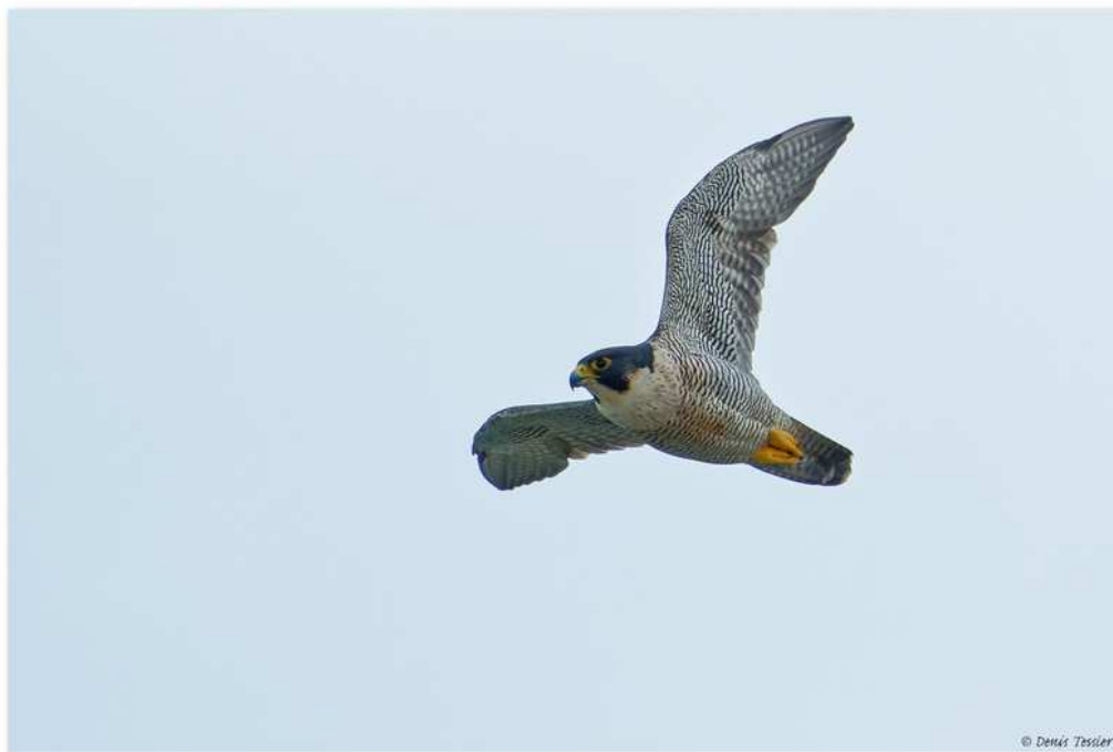
Faucon pèlerin