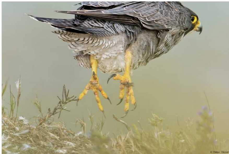
Faucon pèlerin

Les sites de nidification se répartissent sur le littoral et en vallée (Seine, Eure, Iton). Les sites naturels, notamment en falaise, ont été colonisés rapidement, mais les rapaces ont aussi investi les bâtiments (cathédrale de Bayeux, silos du port de Rouen). Ils ont également profité d'installations posées à leur intention (nichoir à l'église Saint-Joseph, au Havre) et de mesures de protection sur les falaises prisées par les escaladeurs afin d'éviter les dérangements en période de nidification et d'élevage des jeunes (LPO Mission Rapaces 2006).