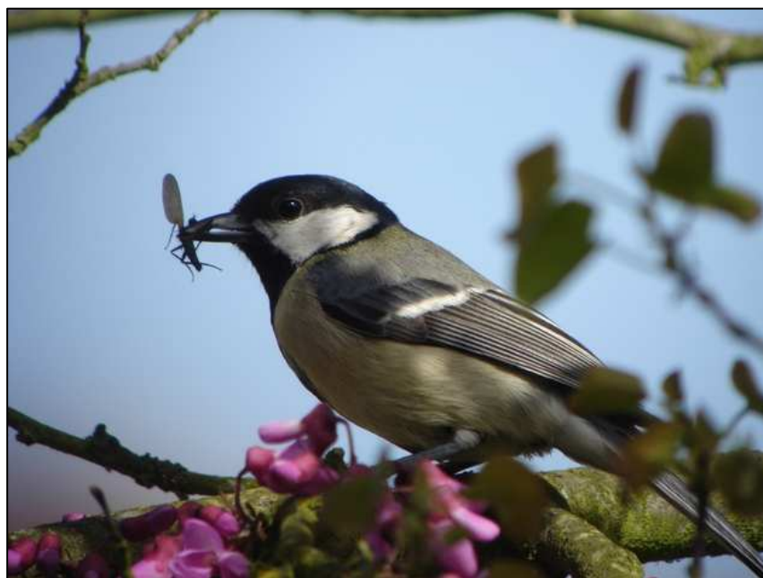
Mésange charbonnière

Très commune toute l'année, son statut semble stable et elle est toujours, en 2018, bien répartie dans toute la région, avec une fréquentation un peu moindre dans le département le moins boisée de Normandie, la Manche.