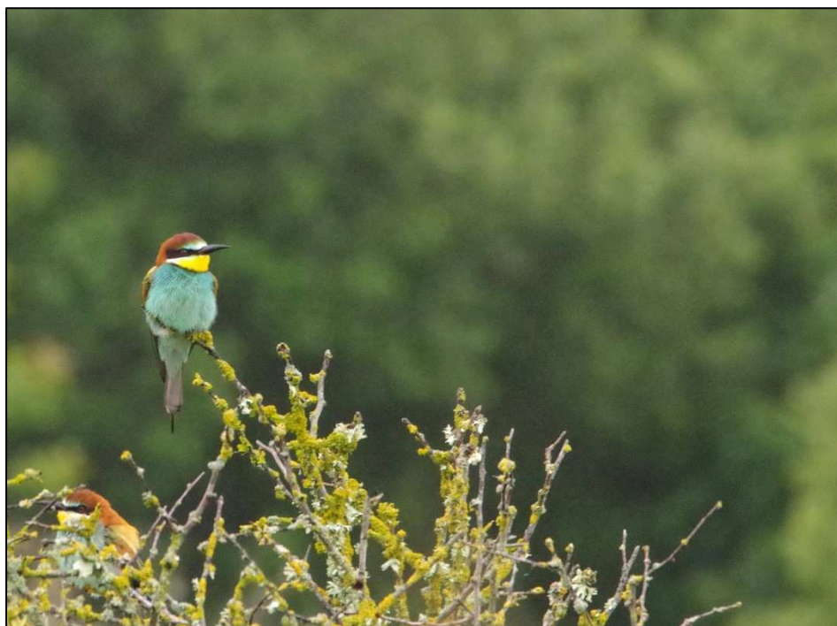
Guêpier d'Europe