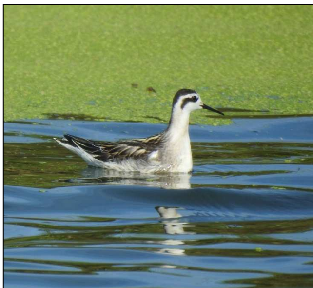
Phalarope à bec étroit