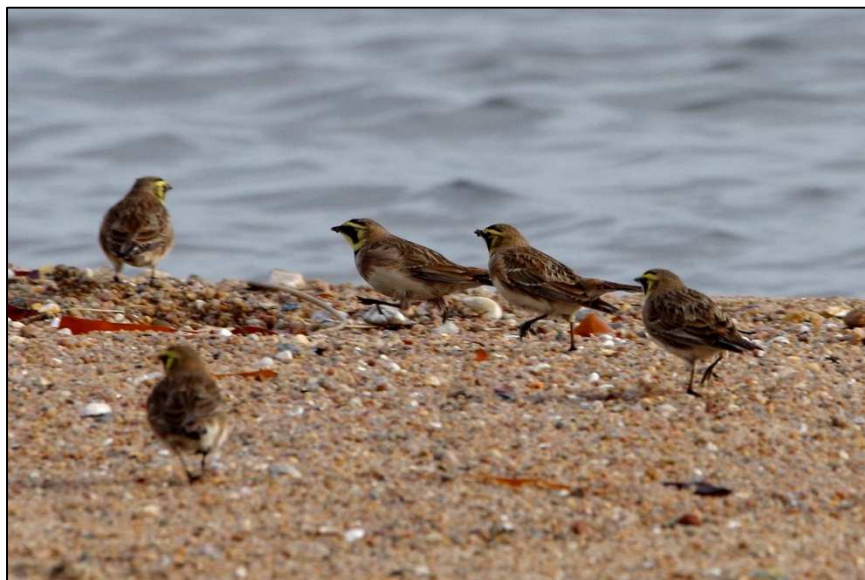
Alouette haussecol