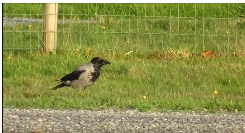
Corneille mantelée