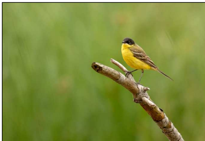
Bergeronnette printanière « des Balkans »