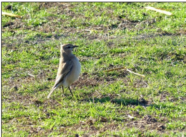
Traquet isabelle