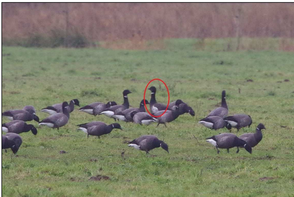
Bernache cravant « du Pacifique »