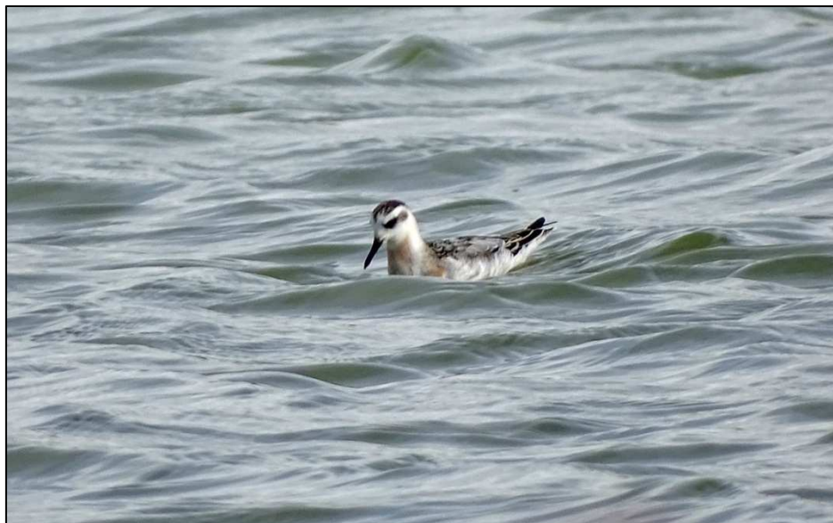
Phalarope à bec large