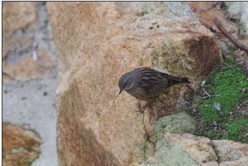
Accenteur alpin