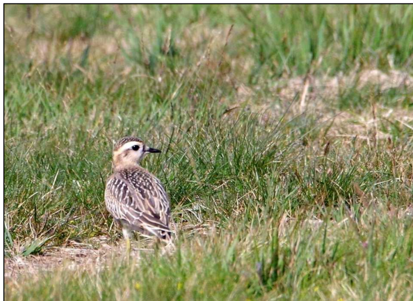
Pluvier Guignard d'Eurasie