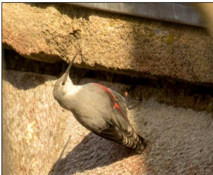
Tichodrome échelette (@ A. Cordonnier)