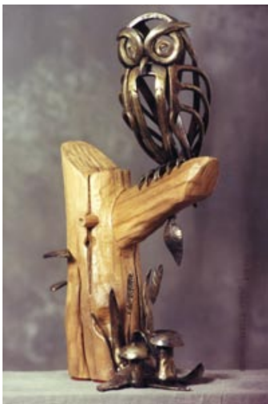
Chouette - sculpture de Pierre Louis Gauger

12/13 mai à Mesnières en Bray 10h à 18h – Salle de spectacles et de loisirs