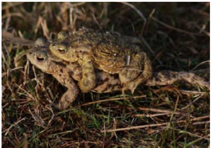
Crapaud commun accouplé