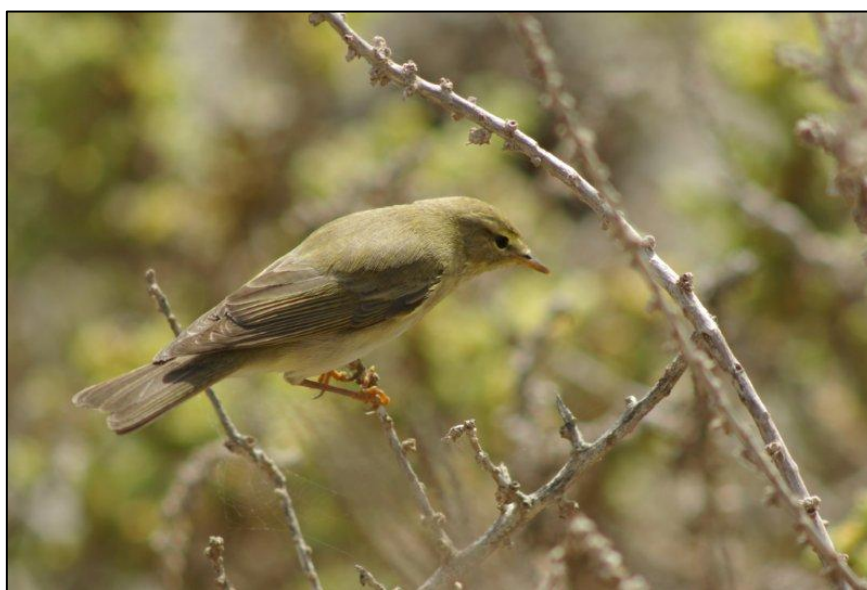
Pouillot fitis

Pouillot fitis. Espèce peu commune, quasi menacée. Sa densité est forte dans ces milieux de landes (3 couples au km 2 ). Son optimum d'habitat est similaire à celui de la Fauvette des jardins. Du reste, comme elle, il s'agit d'une espèce nordique. Il est en déclin dans toute l'Europe.