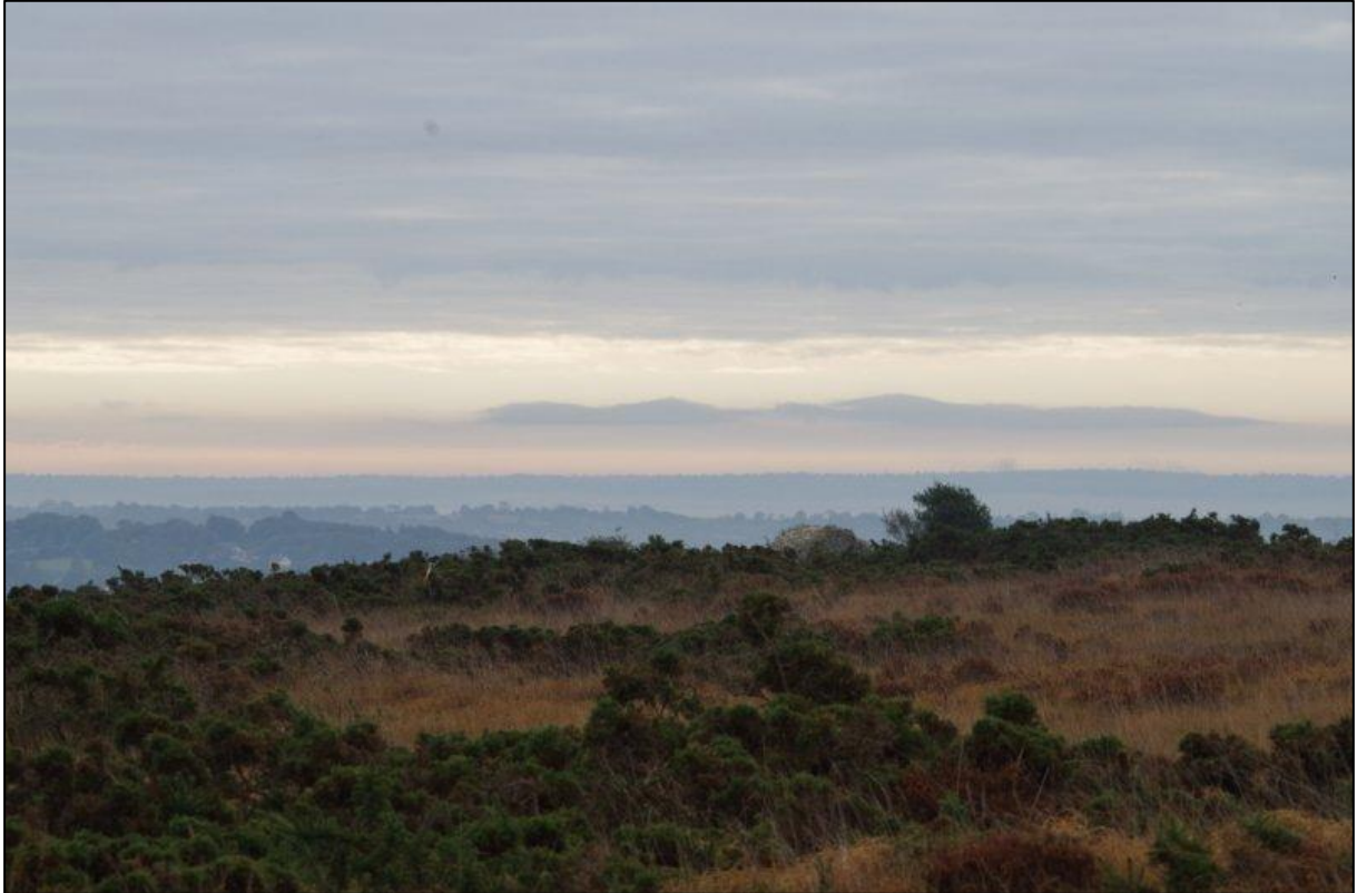
Mont de Derville (Cotentin)