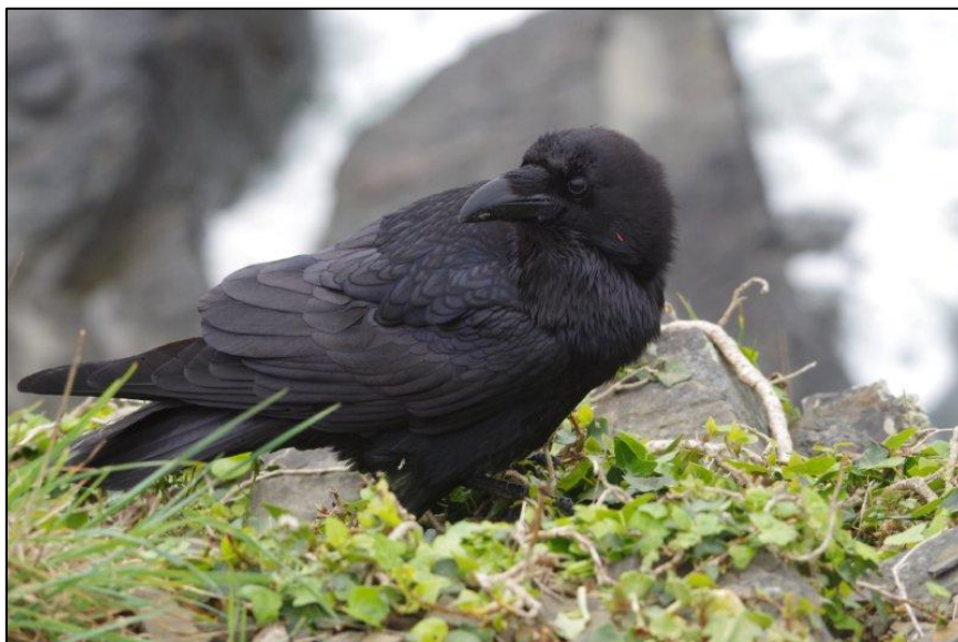
Grand Corbeau

Linotte mélodieuse. Espèce commune, menacée (vulnérable). Ses densités sont très fortes dans l'habitat de landes (14 couples au km 2 ). Nous avons déjà constaté ceci lors de l'enquête sur les vailleuses de la côte d'Albâtre en Seine-Maritime (Malvaud 2008).