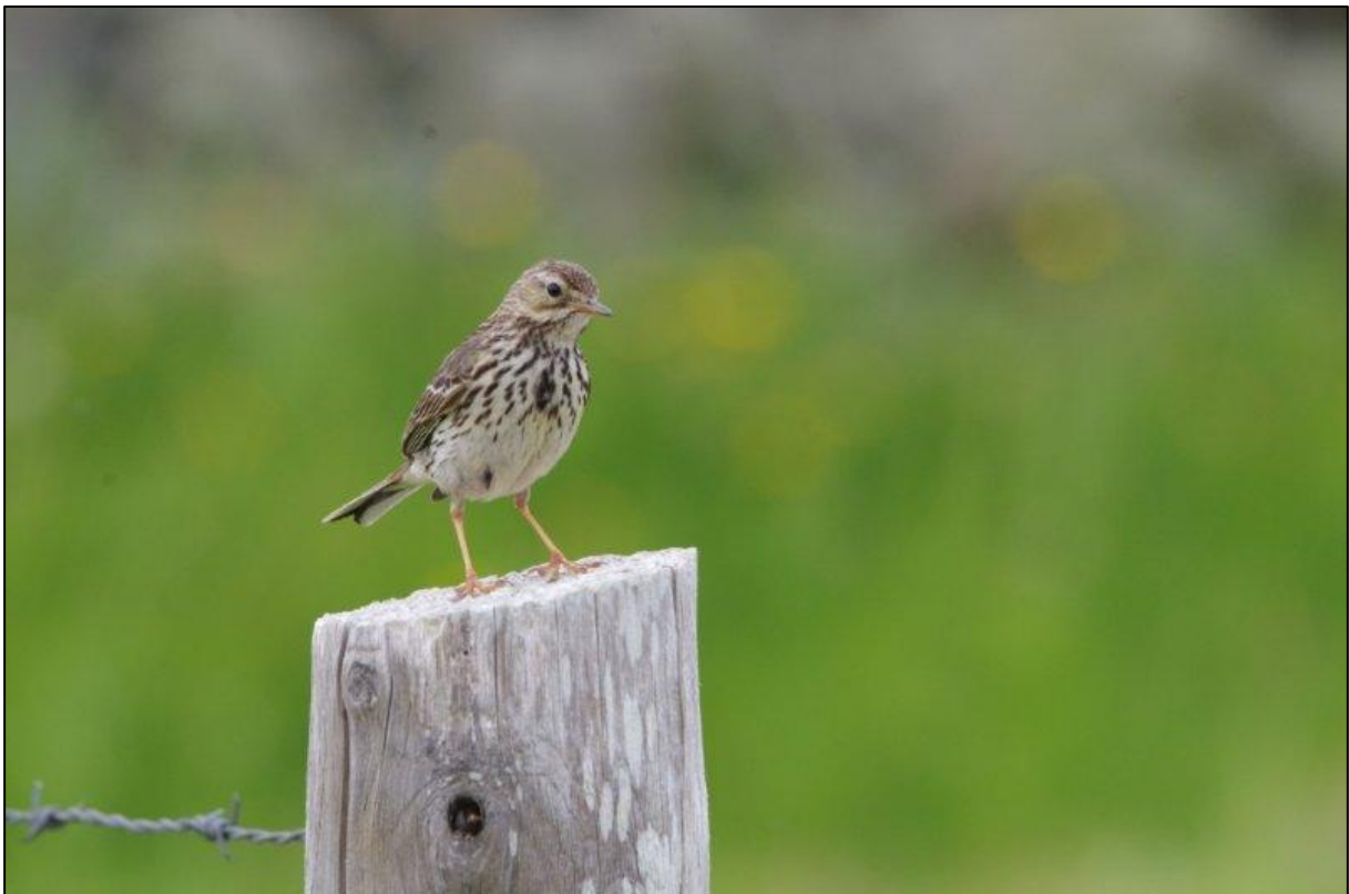
Pipit farlouse

Dans ce groupe d'espèces, on retrouve des oiseaux inféodés aux milieux buissonnants, ce qui n'est pas étonnant. Il faut noter l'absence un peu surprenante de la Locustelle tachetée, même si cette espèce est plutôt en Normandie inféodée à des milieux humides.