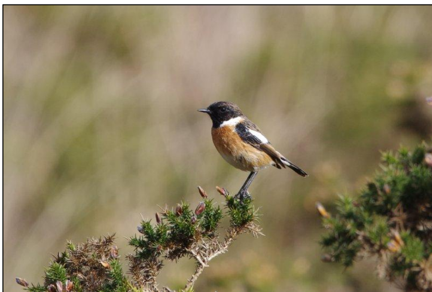
Tarier pâtre

Tarier pâtre. Espèce peu commune. Comme pour la Fauvette grisette, les fortes densités de cette espèce dans les landes (5,8 couples au km 2 ) étaient attendues. Nous l'avons aussi constaté dans les valleuses de la côte d'Albâtre.