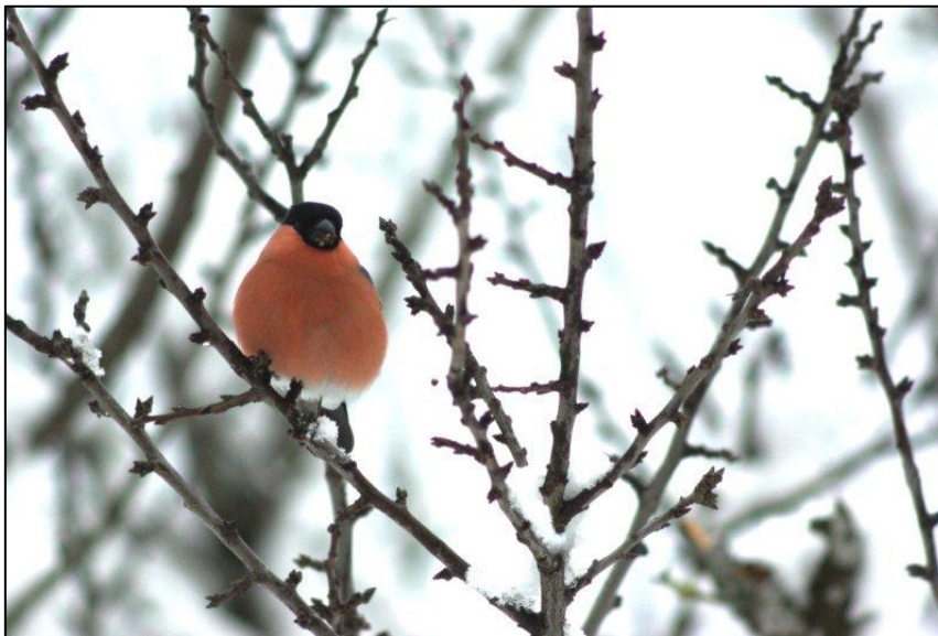
Bouvreuil pivoine

Bruant zizi. Espèce assez rare. Noté sur trois sites : landes de la Pernelle, cap de Flamanville et landes de Vauville.