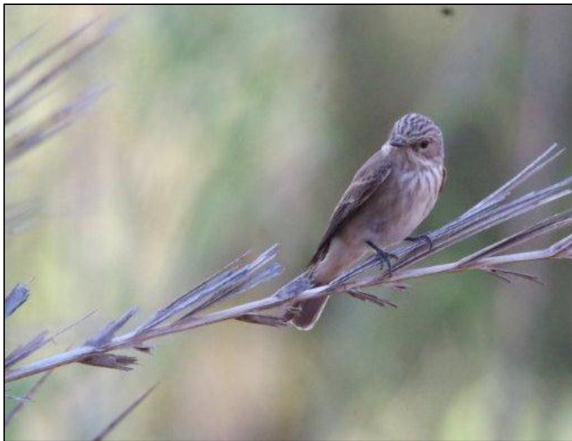
Gobemouche gris

Gobemouche gris. Espèce peu commune, menacée (vulnérable), sa présence dans les landes est marginale (un site occupé par un couple).